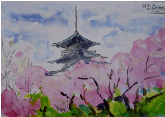
京都・仁和寺の御室桜