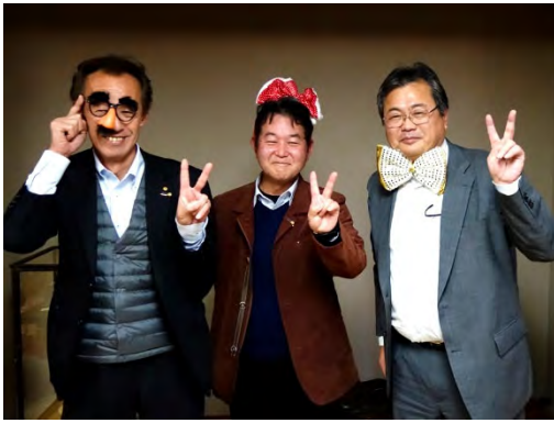
ビンゴ大会が終わり