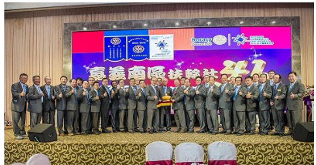
全体社友及夫人合影