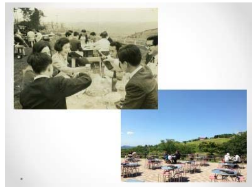
ジンギスカンレストランの移り変わり