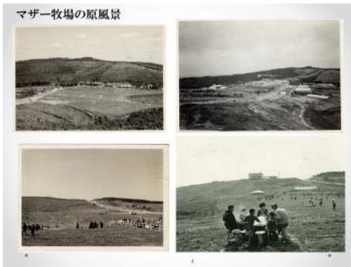
マザー牧場の原風景