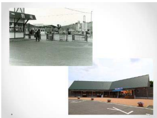
入場入り口の変貌