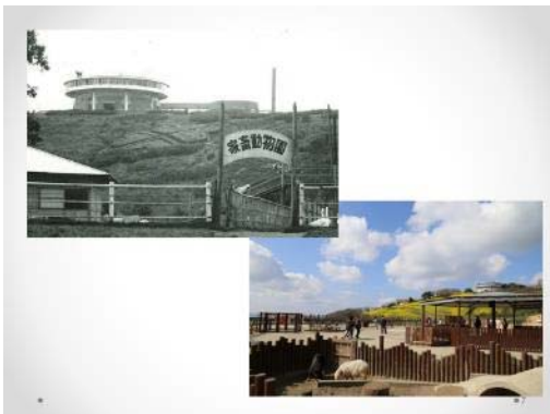
当時の展望台近景と現在の風景