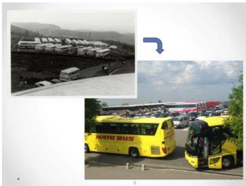
当時の観光バス群と現在の観光バス