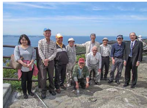
記念登山道にいざ出発の勇姿