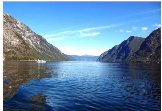
フィヨルドの風景(船の中から)