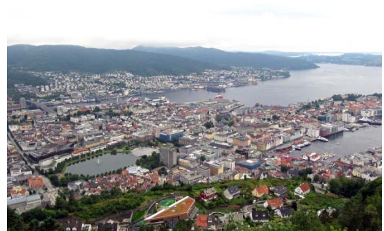
百数十メートルの山の上から見たベルゲンの 街並みとフィヨルド