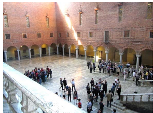
ノーベル賞が授与される広間 (ストックホルム市庁舎内)