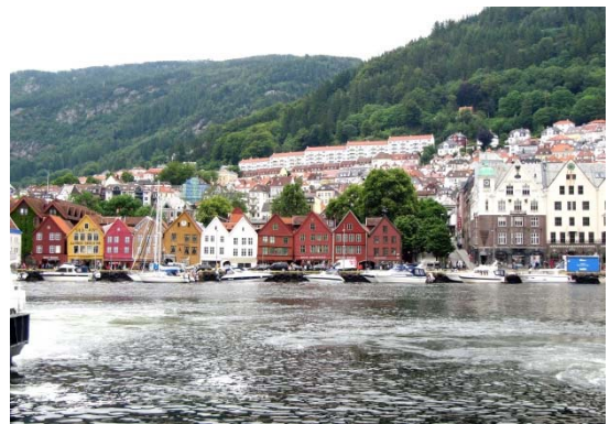
ノルウェイ第二の都市ベルゲンの街並み (世界遺産)