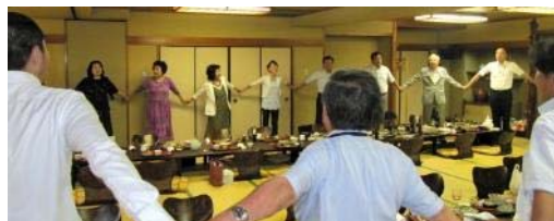
全員で“手に手つないで”合唱