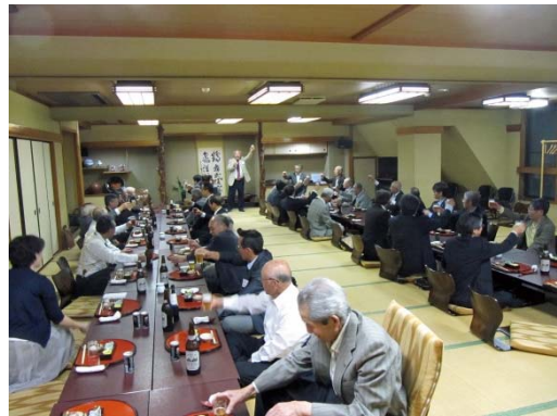
神子ガバナー補佐の乾杯で懇親会スタート