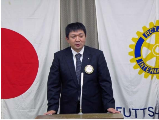
角田、立石の両幹事からも幹事報告がなされた。