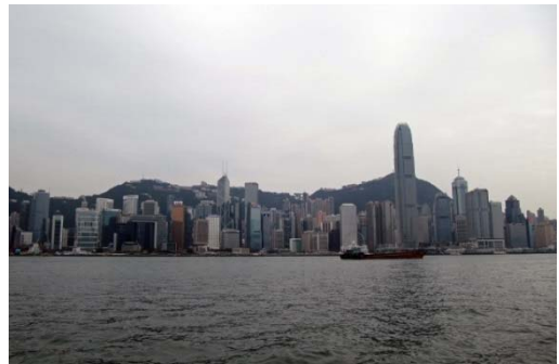
九龍半島から見た香港島のビル群

このような歴史的背景の香港を訪ねて最初に感じたのは、まさに世界の大都市でニューヨークや東京となんら遜色ない大都市の景観でした。宿泊先は、九龍半島最先端に位置するインターコンチネンタルホテルです。わずか1Km程度の海峡を挟んだ香港島の水際に乱立する高層ビル群に圧倒され、更に世界屈指と言われる迫力満点の夜景を3日間、宿泊した部屋から堪能しました。