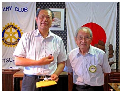
榎本会員4名増強RI記念品

皆さん今日は。今日はすでに8月20日なのに、ここでの例会は今月初めてです。猛暑、体調はいかがでしょう。今月は『会員増強月間』です。担当の方から話があると思いますが、意識を高め年間を通して増強していく体制を作りましょう。