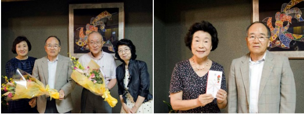
会長・幹事に花束贈呈 女子会に金一封贈呈