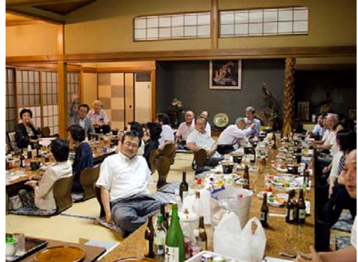
オークションで今年度赤字は解消。