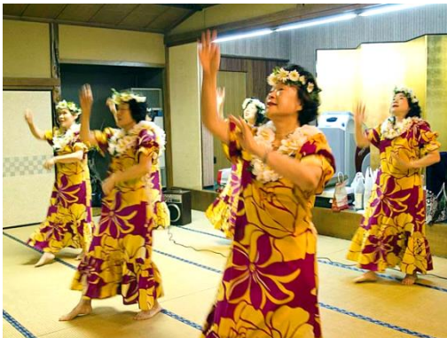
新調の衣装も映えるフラダンス 女子会