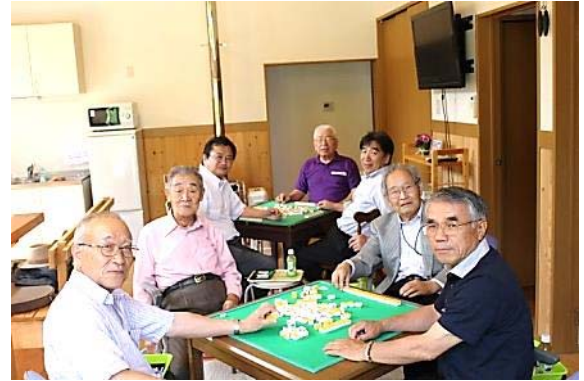
対局前の穏やかな表情

例会終了後 15 時より志駒荘にて開催されました。 半荘 5 回戦。麻雀は実力or運 勝敗の行方は？