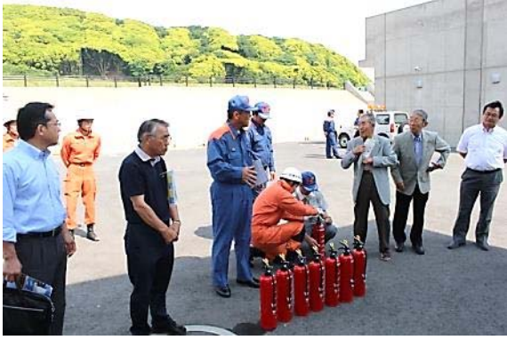
消火器の取り扱い訓練