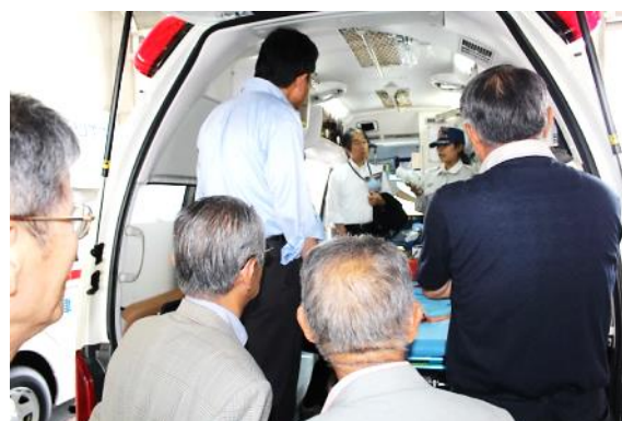
救急車の中での説明