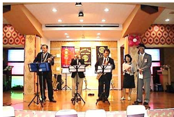
When The Saints Go Marching in (聖者の行進)