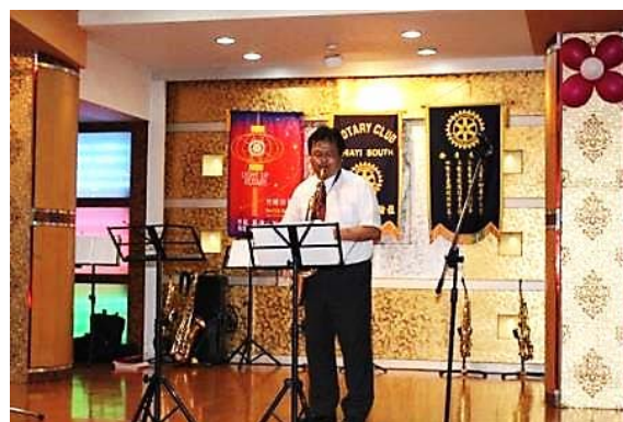
Watermelon Man (ウォーターメロンマン)