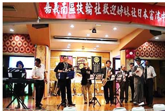
Besame Mucho (ベサメムーチョ)