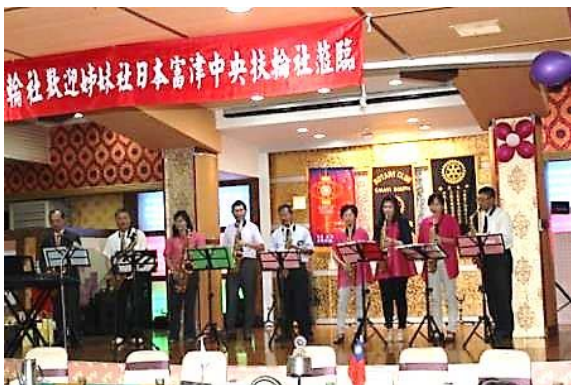
這是咱的扶輪社 (This is Our Rotary Club)