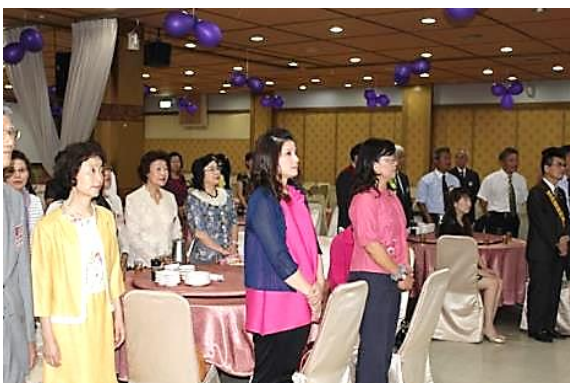
ロータリーソング