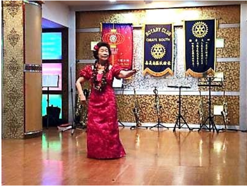
夏威夷舞 Kaimana Hila