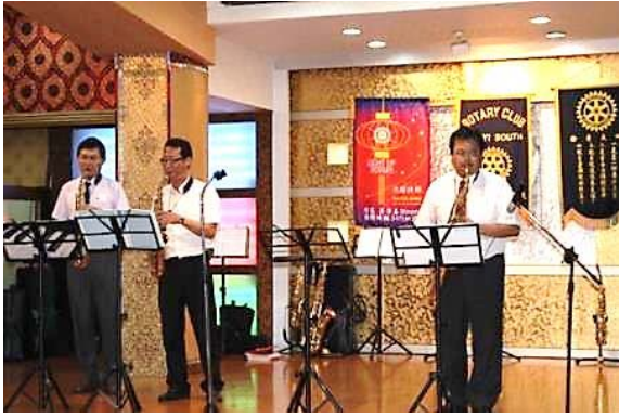
MERCY MERCY MERCY (マーシー・マーシー・マーシー)