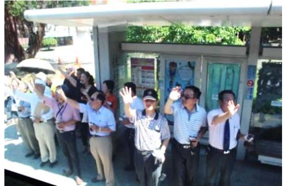
再見 再見 再見