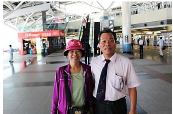
謝謝 再見 葉会長夫妻 高鐵嘉義駅