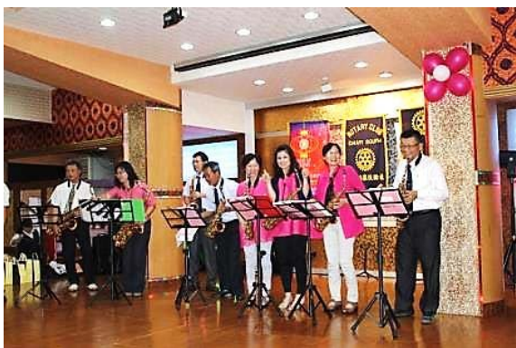
望春風(恋ごころ) 小蘋果(Little Apple 小苹果)