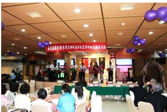
小蘋果(Little Apple 小苹果)