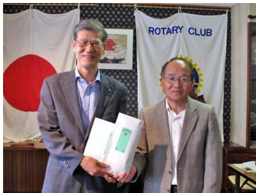
直前会長に記念品贈呈