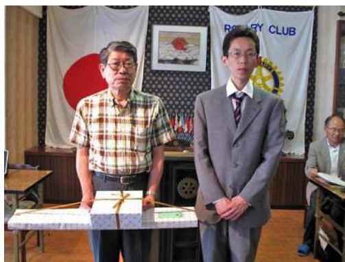
直前幹事に記念品贈呈