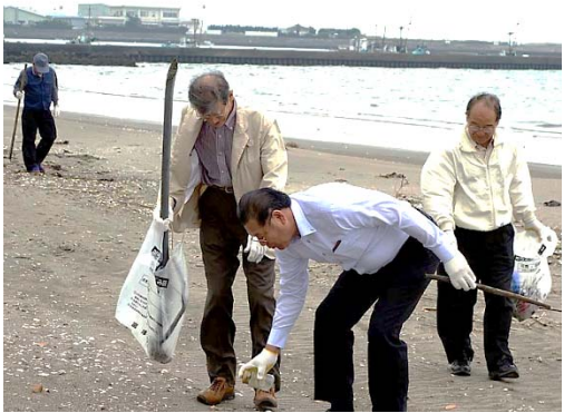
腰を落として拾う