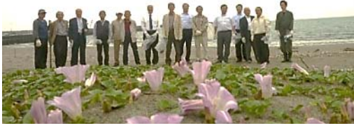
小雨も上がり、いざ