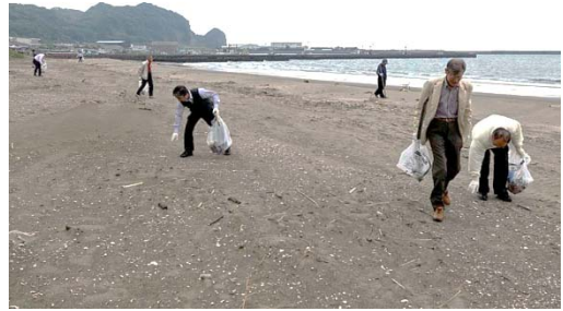
一昔前より少ないゴミ