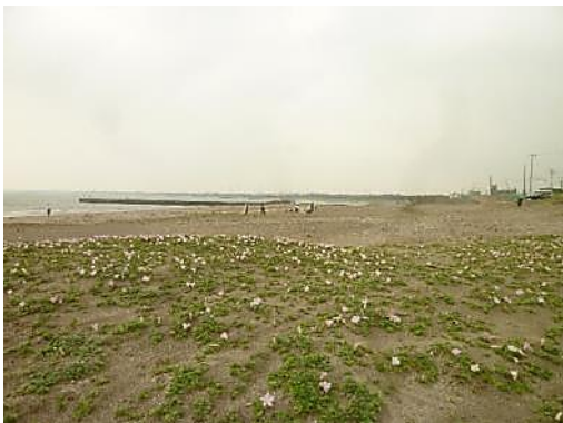
はまひるがおもよろこんで