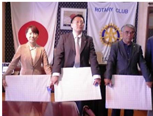
新入会員の皆さんよろしくお願いいたします

勧誘のきっかけは、ホテルオークラ東京で開催されたRIの増強会議でした。その議事の中で身近な人を誘ってはどうかとの提案がありました。一番身近な人物がまさに彼でした。地元出身ではないので地域のロータリアンの皆様の仲間に入れていただいて、多くの友人を得、更に磨かれて、教養豊かに成長してもらいたいと入会を勧めました。会社にあっては実務の中心ですので、例会への出席ままならないと思いますがメーキャップ等をして補ってんさせたいと思っています。よろしくお願いいたします