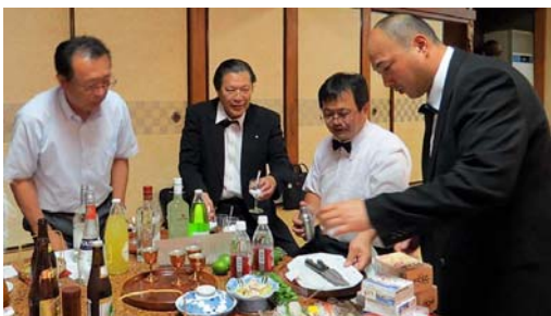
カクテルコーナーにはヘビー級バーテンダー4人