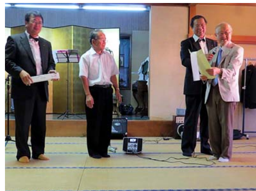
恒例となった三枝会員よりの俳句贈呈