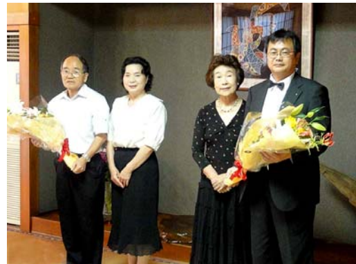
女子会代表より会長幹事に花束贈呈