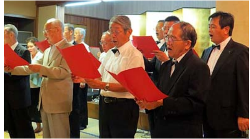
ベートーヴェン第九歓喜の歌 ピアノ伴奏小野会員