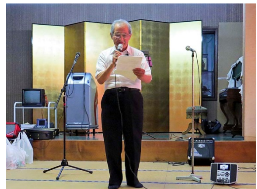
千葉会員より会長幹事へ感謝の言葉