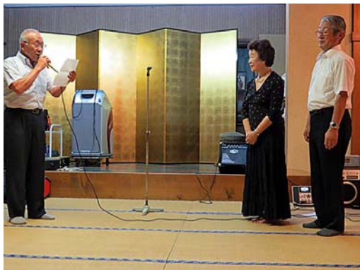
原田次年度会計より大網夫妻に感謝状

あなたたちご夫妻は常に笑顔を決やらずクラブのためを一途に思い、それぞれの立場で立派にその任を果たしました。