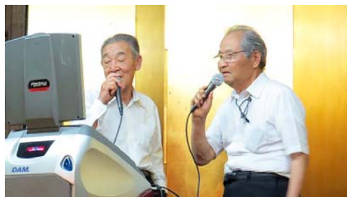
ノラ:高島会員 千葉会員