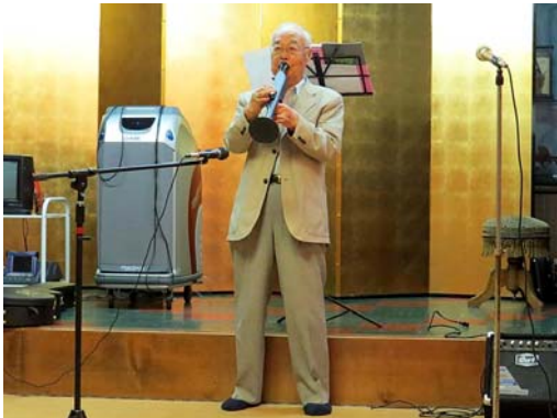
乾杯:消灯ラップに続き進軍ラップ 志波会員