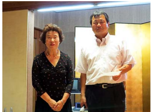
会長より女子会に感謝状

あなた方は時々例会に出席し、会場に花を添えて下さったこと有り難く心より御礼申し上げます。