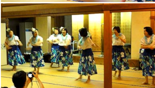
フラダンス三曲：女子会員