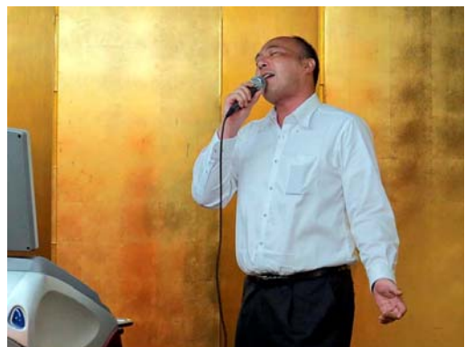
平野会員の喜びの歌。