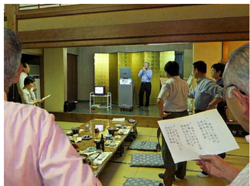
大網会員のハーモニカで「故郷」斉唱。