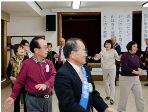
全員で輪になって 花かげ