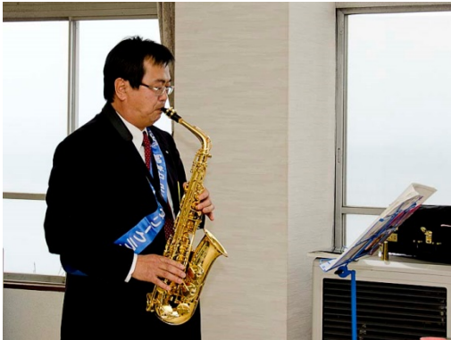
挨拶代わりのサックス・ソロ 「A列車で行こう」 ビリー・ストレイホーン作曲