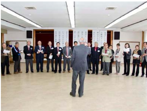
塩山クラブの斉唱に富津中央から飛び入りも