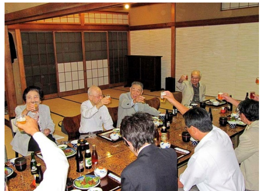
志波チャーターメンバーの乾杯の音頭