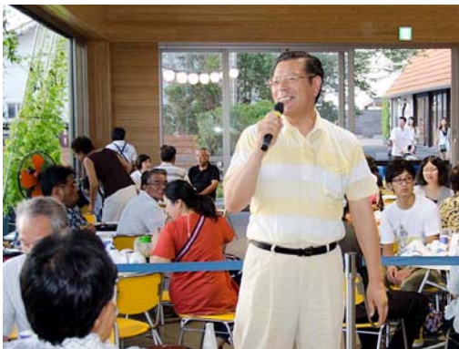
進行係榎本親睦担当部長