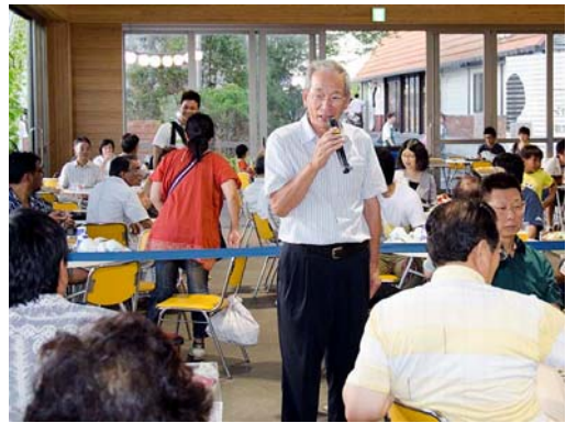
富津シティRC石綿幹事様御挨拶