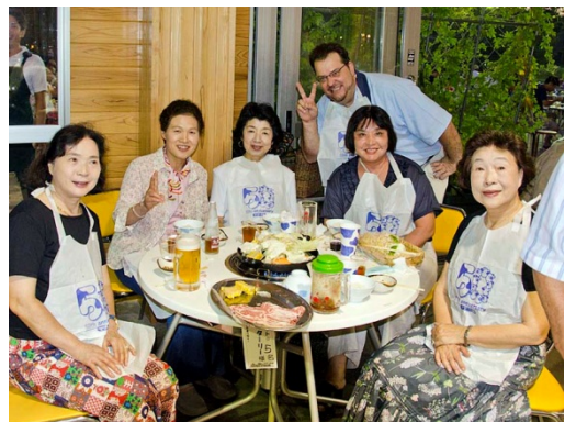
ご婦人方と話した後は皆さん記念撮影