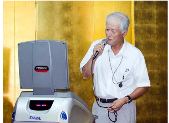
60歳台代表石渡会員。この後30歳台の刈込会員まで続いた。