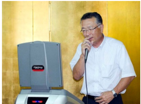
新人多田会員は玄人裸足の歌い振り。