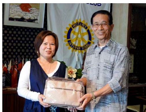
スーリーさんに感謝の品を贈呈

〒293-0042 富津市小久保2868 さざ波館 Sazanami-kan 2868 Kokubo Futtsu-shi Chiba-ken, Zip code 293-0042 Tel.0439-65-3373 Fax.0439-65-3304 URL http://www.futtsuchuo-rotary.org