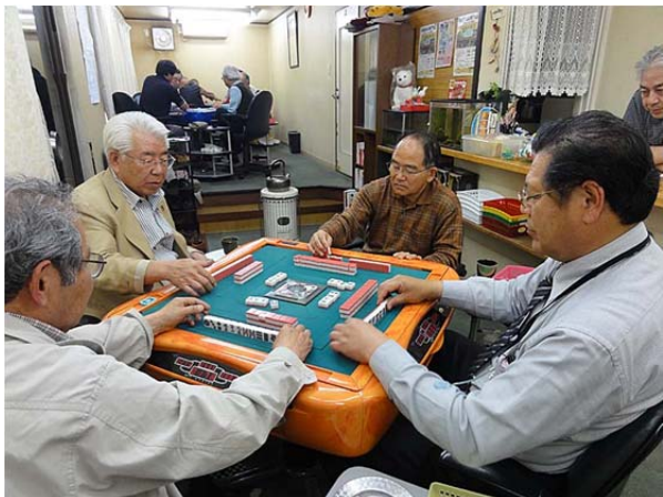
3卓で競技中。席は奥から直前の得点順。

スケッチの在庫が少なくなってきたので、今週は親睦麻雀大会を見に行きました。(しば)