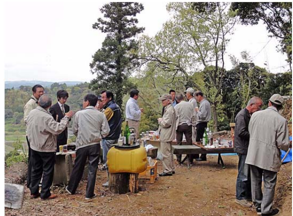
三々五々、奉仕について語り合う