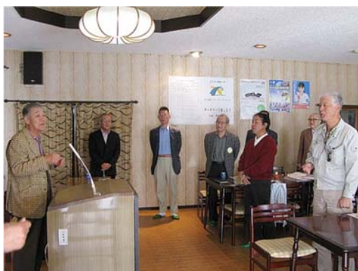
バースデイ・ソングで祝福