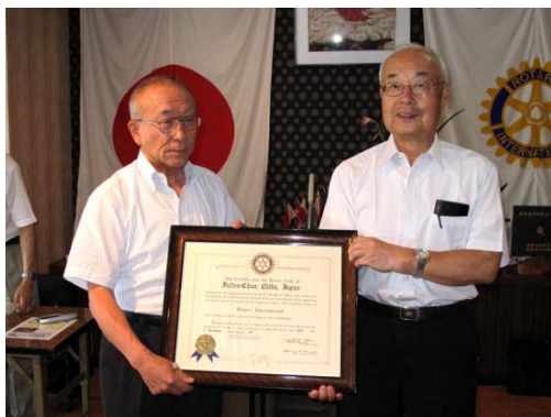
志波直前会長から原田会長に