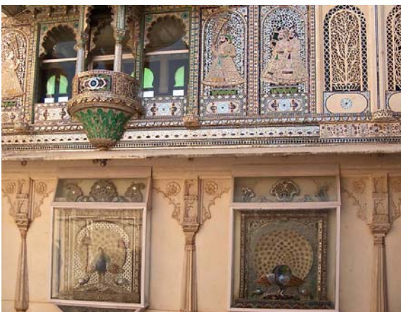
ウダイプールのマハラジャのパレス。

12～18世紀に建てられた廟、城、宮殿等を幾つか見ましたが、どれも手の混んだ細工を施し、高度の建築技法が覗かれる石造りで保存状態も良く見応えがありました。