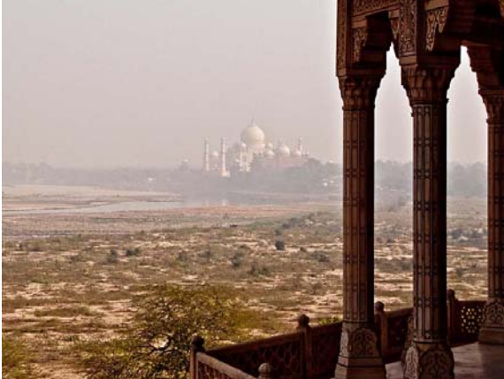
アグラ城から見たタージ・マハル

ジャイプールのアンベール城を見学する時、象に乗りました。結構高さが高いですが、手摺の付いた台があるのであまり怖くはありません。ただ、進行方向に向かって左右に大きく揺れるので、乗り心地は良くありません。象使いは首の所に乗るので、楽そうに見えます。象は左右の前後足を同時に前後に動かして歩くようですが、確認はしてありません。