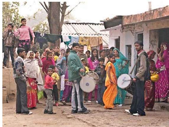
アグラ 結婚式準備中

万人弱の人口増があるとのことでしたが、どこへ行っても人が沢山、それも若い人が多くて驚きました。最初のレストランで軽食を取った時、何種類かのサンドイッチが出たのですが、種類毎に運ぶボーイが違い、何かワークシェアリングの見本みたいでした。また、デリーからアグラ迄200Km程をバスで移動する間、殆ど途切れ無く人が大勢見えたのには圧倒されました。それにしてもインド人は足が長くてスタイルの良い人が多いです。そのせいか、男性トイレが高く一寸周章てさせられます。