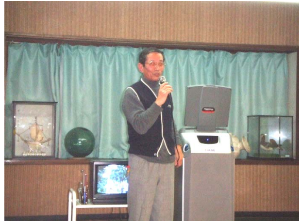
「一本じめ」小野次次期会長。