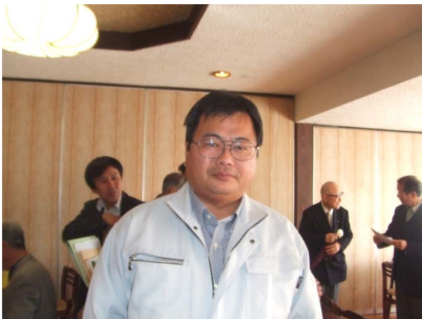
(例会が終わって理事会)