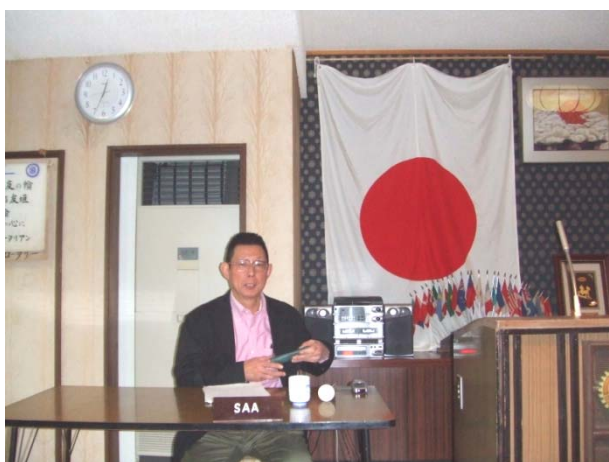
(進行 平川 SAA)