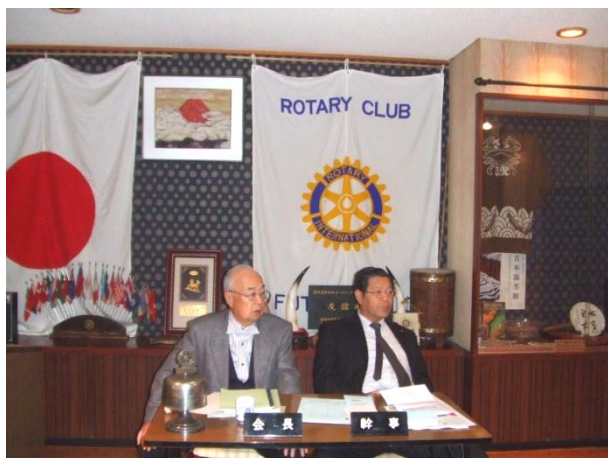
(志波会長と榎本幹事)