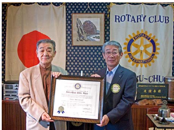
大網直前会長から高島新会長へ