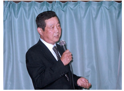
情感溢れる三平会員