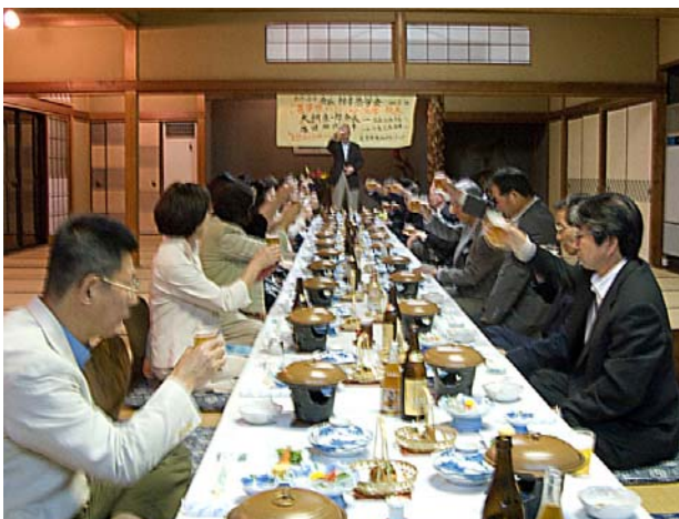
二番目の最年長が乾杯の音頭とり