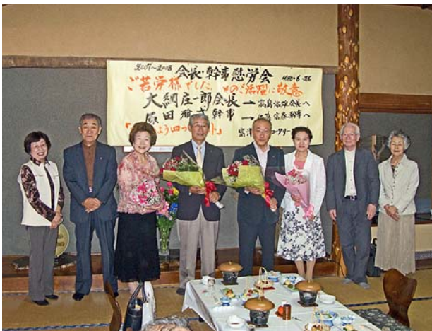
次期会長幹事夫妻より現職夫妻に花束贈呈