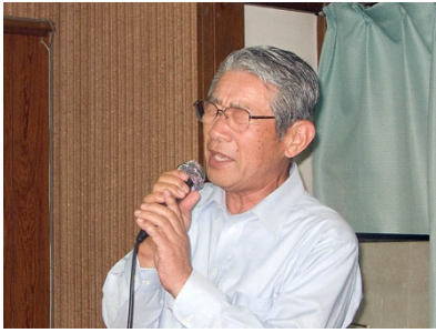
カラオケ教室6年を披露する会長