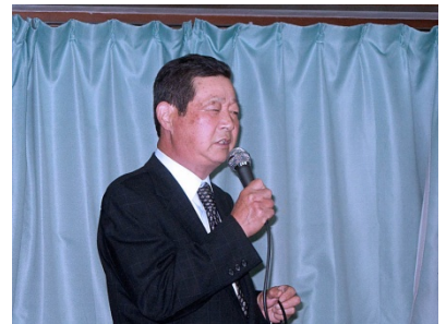
再入会をお待ちします