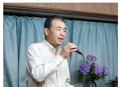
大取はスタジオ所有の永島会員