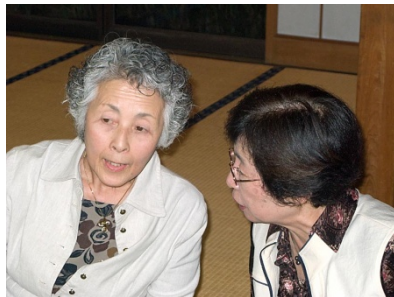
次期会長・幹事夫人