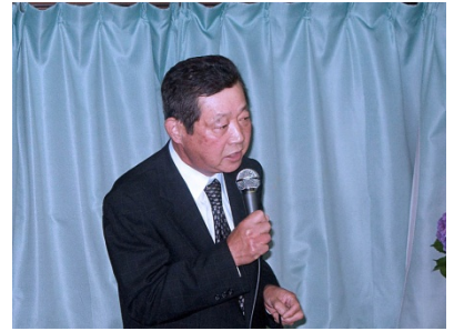
優しい場面は優しい顔で