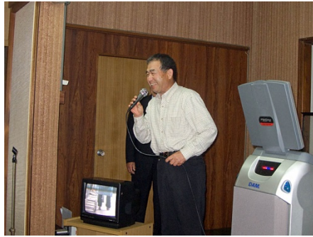
宴会の進行はプロフェッショナル