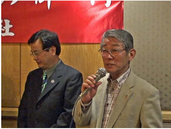
大網団長挨拶 台南西区扶輪社にて