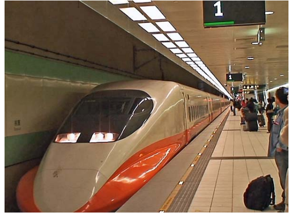
台湾高速鉄道桃園駅