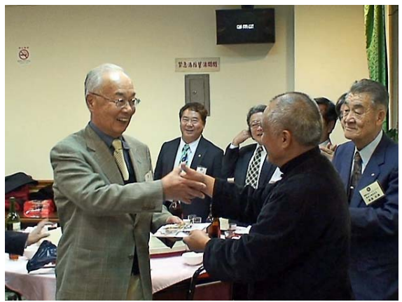
阿里山郷に図書費贈呈