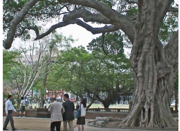
台南孔子廟前ガジュマロ