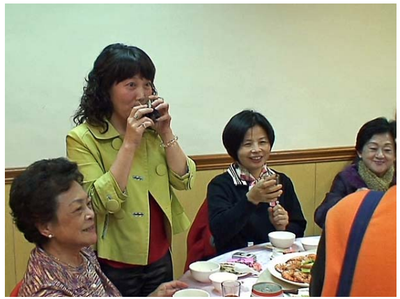
嘉義南区会員ご夫人 阿里山閣ホテルにて