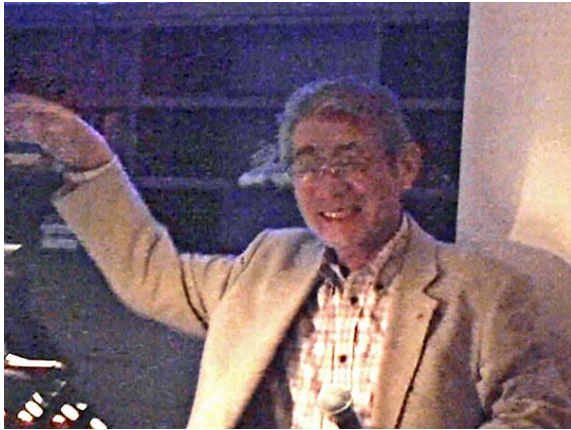
二次会で寛ぐ大網団長 台南維悦統茂酒店にて