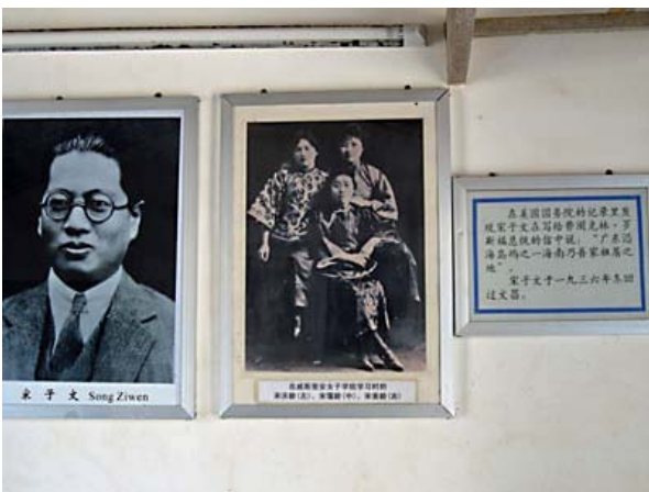
兄の宋子文と左から次女慶齡、長女靄齡、三女美齡