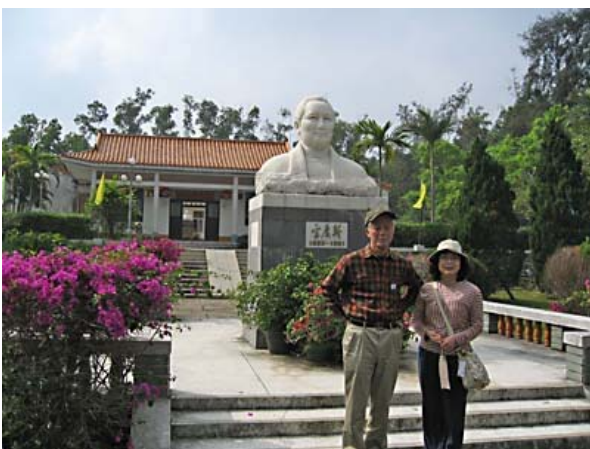
孫文に嫁いだ次女慶齡像前で記念写真

日本でいえば土間造りの庄屋さんの家といったところか、素朴で質素ではあるが石造りのがっしりした家。三姉妹とは宋美齡(蒋介石夫人)、宋慶齡