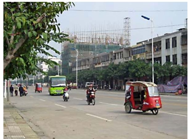
庶民のタクシーはタイのツクツクよりやや小さい

喫水が深いのでマングローブには近づけない観光船 乗せられた観光船?、これが年代物というより廃船を繕ったシロモノでスリル満点、それでもと言うかさすがと言うか救命胴衣の古着みたいなものは完備されていた。しかし危険を冒してまで見に行くほどの天然保護区ではなかった。