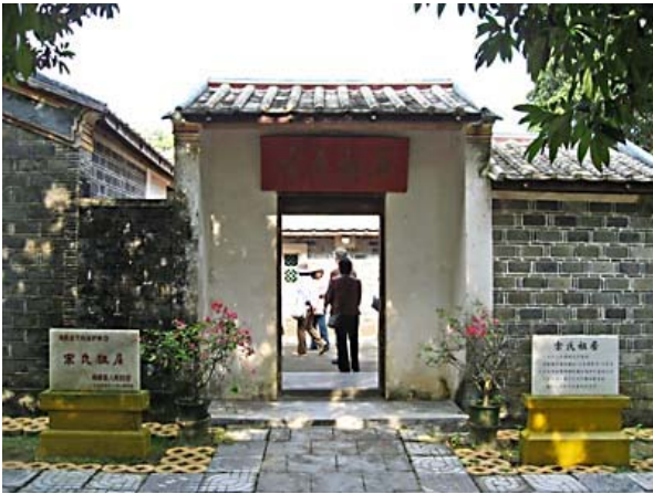
宋三姉妹祖父の生家入口

るベンツ車と絶えず行き交う、かと思うと突然、発動機をエンジンとする満載のトラックが逆走して来たり、次は裸足のおじさん率いる牛の群れに遭遇する。やがてつぎの見学地「宋三姉妹の祖父の生家」に着く。