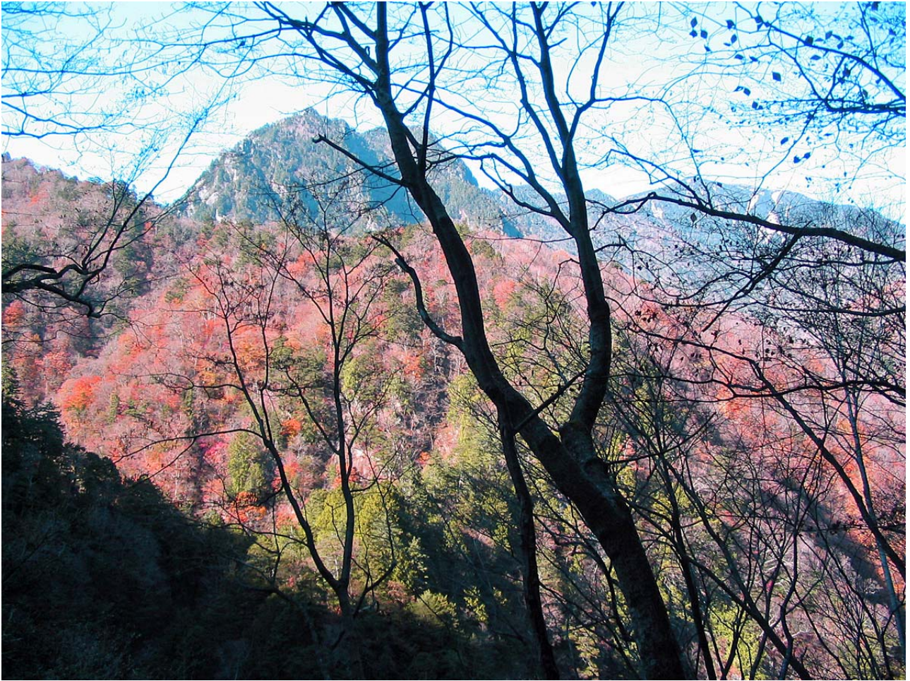
トロッコ道から望む樹林越しの景観。

今回はさゞ波館のバスを利用させていただき、同館を早朝 6 時に出発。佐貫地区を回って車中で朝食をとりながらアクアラインを経由、一路中央自動車道へ。