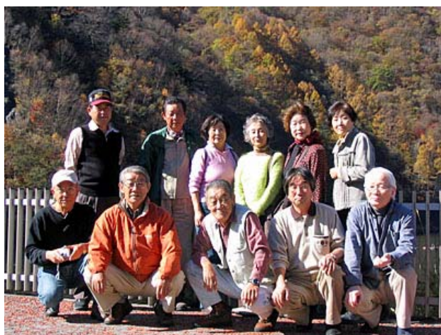
参加会員・家族 11 名、広瀬ダムにて。