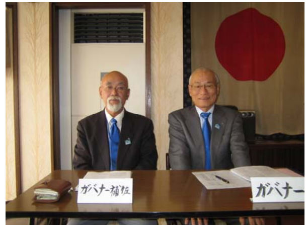
白鳥ガバナーと白熊ガバナー補佐