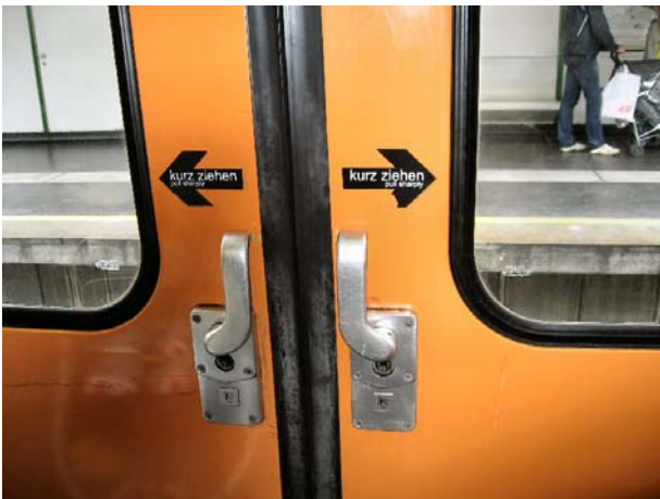
ウィーンのエ車のドア