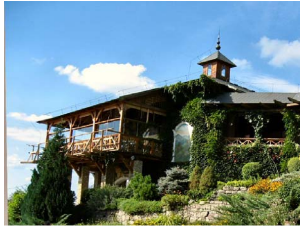
ヴィシェグラード