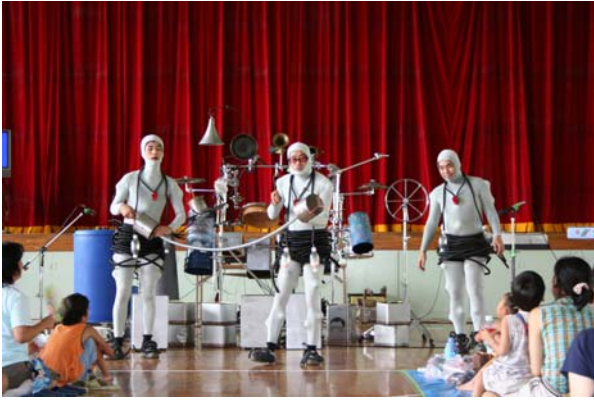
【ガラクタコンサート・スタート】