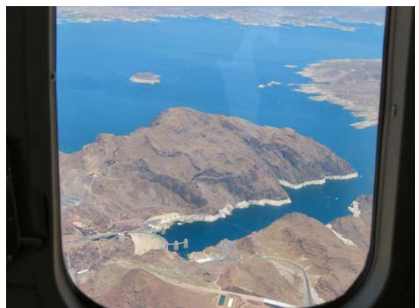
上から、アルカトラズ監獄島、パウエル St.、ラスベガス大通り(ストリップ)、フーバーダムとミード湖