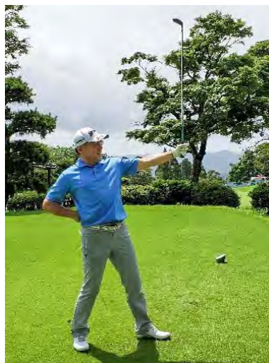
ベージュの面影 鈴木