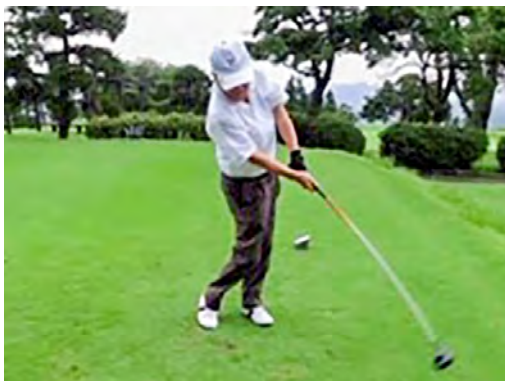
インからアウトに振りぬく 若鍋