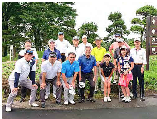
精鋭ロータリアン 15名

〒293-0043 富津市岩瀬 841-3 いち川旅館 Ichikawa ryokan 841-3 Iwase Futtsu-shi Chiba-ken, 293-0043 Tel. 0439-65-0177 Fax. 0439-65-0178 URL http://www.futtsuchuo-rotary.org