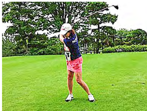
自己新期待のスタート 鎌田