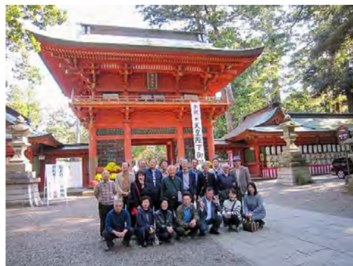
鹿島神宮前にて記念撮影