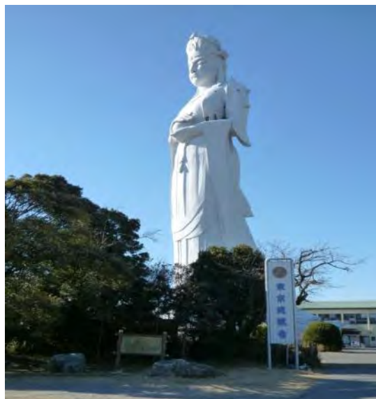
初冬の陽光を浴びる東京湾観音