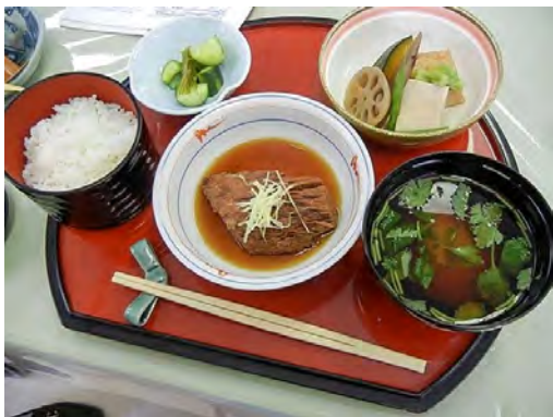
マグロカマトロの煮付け