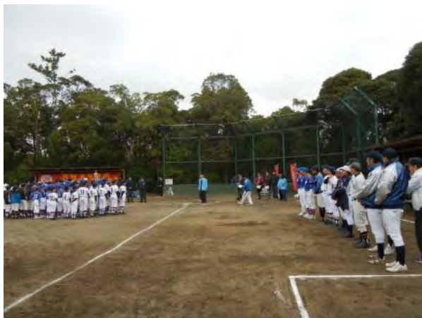
少年野球チームの整列風景