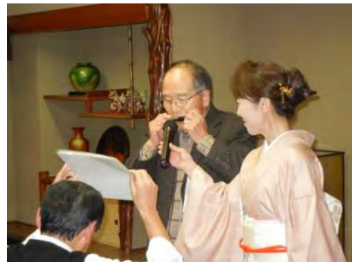
「箱根八里」で初演奏する若鍋会員