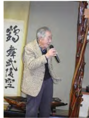
カラオケの見本を示す長老の高島会員