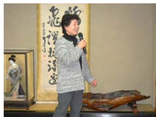
アンコールまで飛び出した相川会員の歌唱力