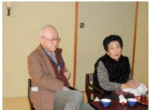
余興を楽しむ三枝会員ご夫妻。