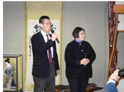
仲睦まじい会長ご夫妻