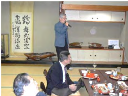
カラオケのトップバッターは大網会員