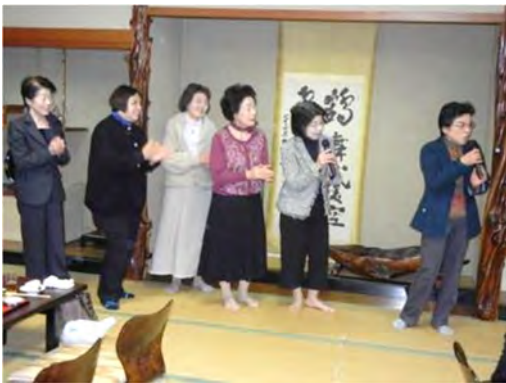
ご夫人達による華麗なコーラス