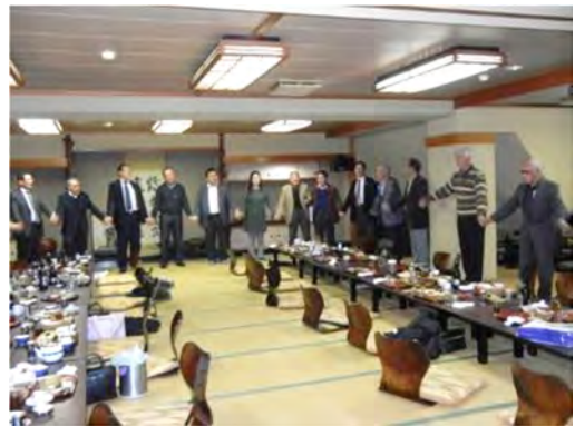
全員で「手に手つないで」を合唱