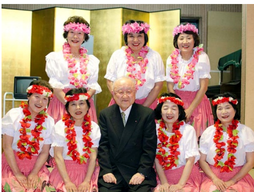
三枝会員とフラ・レディズ