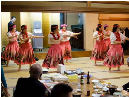
「パーリーシェルズ」