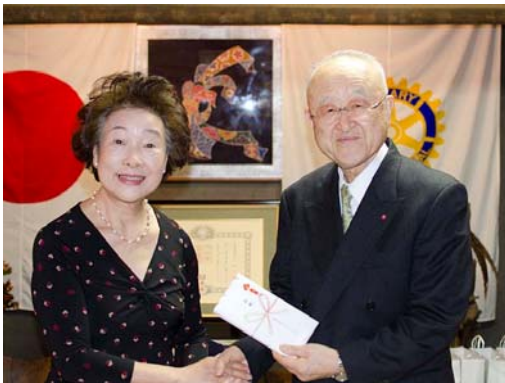
三枝会員へ大網夫人より