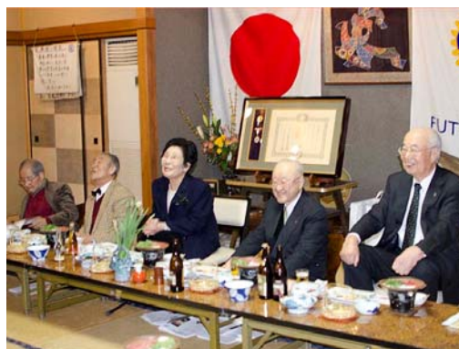
三枝夫妻、志波、高島、千葉各会員