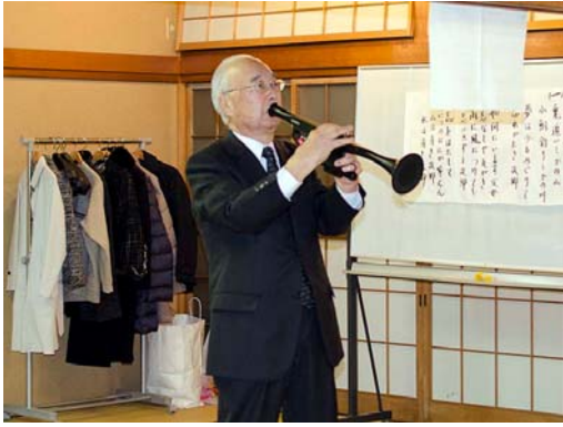
「南国土佐を後にして」