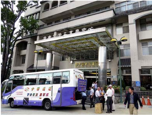
二泊目の関子嶺統茂温泉ホテル(台南市)。