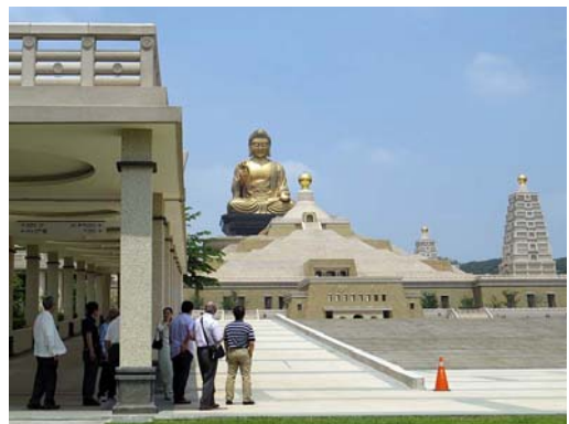
高雄市郊外にある広さ30万坪余の佛陀記念館。