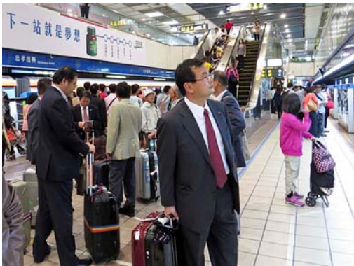
松山空港から台北駅までは電車(MRT)。途中乗換の忠孝復興駅ホームで先確認中。