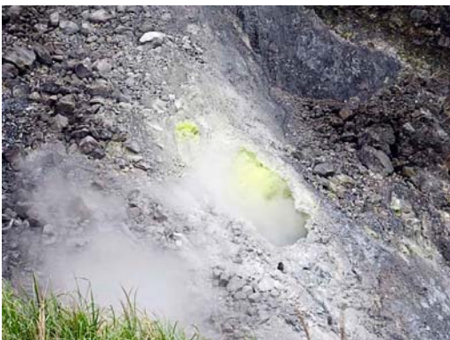
故宮博物院の裏山といった感じの陽明山にはこんな噴気孔が幾つかあって音がすさまじい。