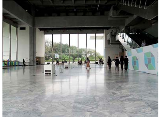
台北市立美術館。美術品修復展開催中だった。