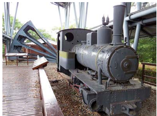
烏山頭ダムに隣接する八田與一記念公園の一角。