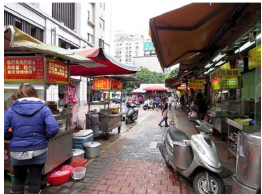
ホテル近くの屋台。ここで買った「からすみ」は美味しくて、値段も空港売店の半値以下だった。