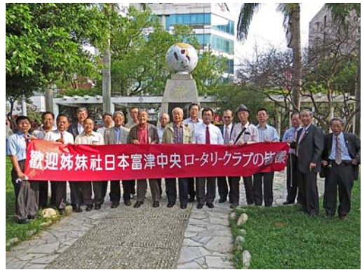
嘉義駅近くの姉妹クラブ記念「友誼永固」碑前。