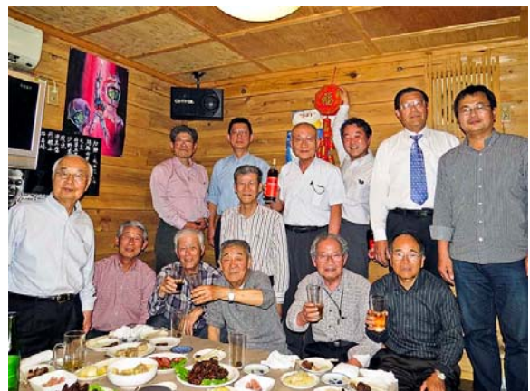
居酒屋「れいちゃん」で砂払。 多田会員は都合で欠席、千葉会員飛入。