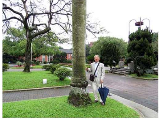
台湾大学キャンパス散策。