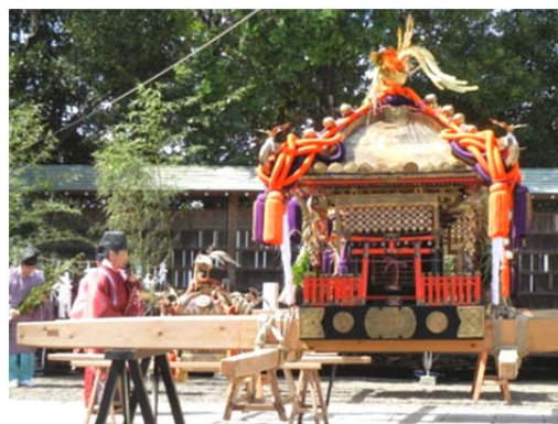
宮司よりお祓いを受ける御輿