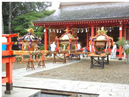
勢揃いした三基の御輿