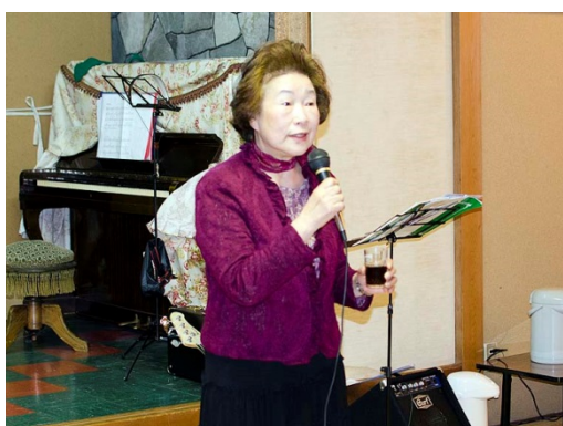
乾杯音頭。女子会長 大網夫人