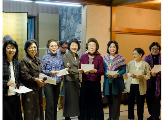
歌い終わって晴れやかなコンテンポラリーの美女。