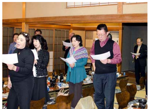
大網会員のハーモニカ伴奏で「故郷」を歌ってお開き。