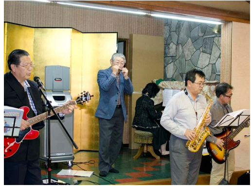
時間の都合でメンバーが揃わない中、熱演する富津中央ロータリーバンド。