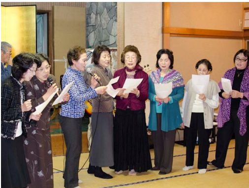
女子会のコーラスは「花」、「四季の歌」、「恋のフーガ」。綺麗なハーモニーで満場を魅了。