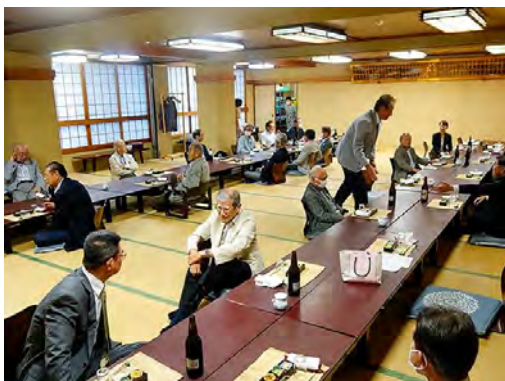
ソーシャルディスタンスの配膳模様