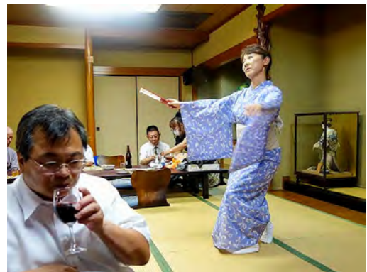
(余韻に浸るか、会長幹事)