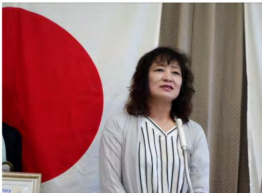
(入会されて約一年、やっと歓迎会)