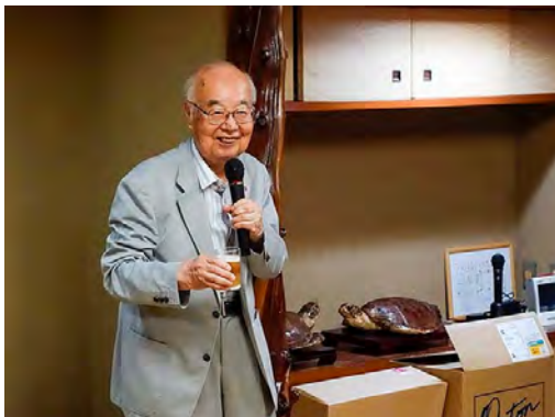
(創立54年チャーターメンバー益々盛)