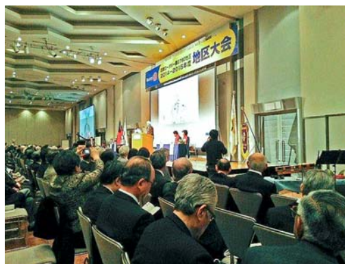
会場 アパホテル幕張

国際大会は、今年度はブラジル・サンパウロ市で6月7日から10日に亘って開催され、次年度(2016)は韓国・ソウル市で開催されます。